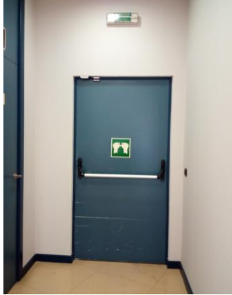
S3: Puerta salida de planta a escalera E1.