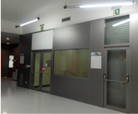
S5: Puerta salida de planta a escalera E1.