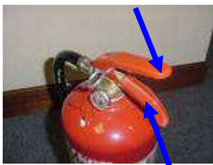
Fig 1 Presurizador